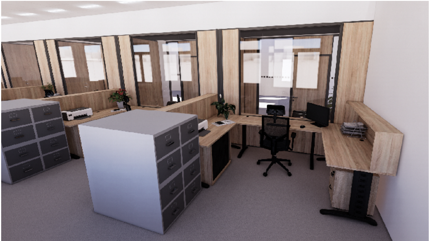
1NP - PŘEPÁŽKOVÁ PRACOVISTĚ REGISTRU VOZIDEL, ZÁZEMÍ

VÝŠKOVÝ SYSTÉM Bpv, SOUŘADNICOVÝ JTSK ±0,000 = 251,28m N. M.