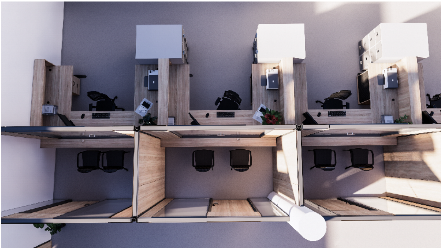
1NP - PŘEPÁŽKOVÁ PRACOVISTĚ REGISTRU VOZIDEL